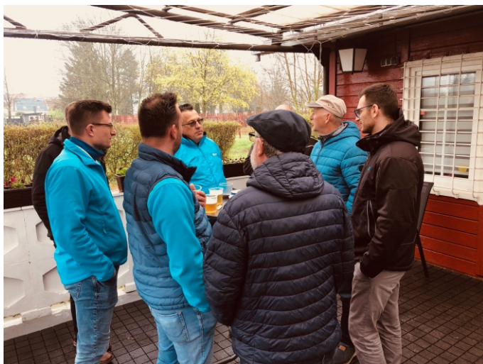
Die Vertreter der Deutschen Glasfaser standen auch beim Bobbauer Frühlingserwachen zur Verfügung. Kompetent beantworteten sie die Fragen unserer Einwohner.

Deutsche Glasfaser: Das Verfahren, mit dem Deutsche Glasfaser die Häuser anschließt, macht Grabungsarbeiten im Garten unnötig. Gegebenenfalls muss ein kleines Kopfloch an der Hauswand gegraben werden, um das Kabel dort durch eine Bohrung ins Haus zu führen. Das Kabel wird vom Bürgersteig aus unterirdisch Richtung Haus geschossen. Die notwendige Bohrung durch die Hauswand erfolgt vom Keller oder Erdgeschoss aus. Die Hauseinführung wird abschließend wasserdicht versiegelt.