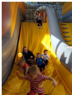
Ausflug ins Igel Mizzi