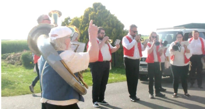
Fanfarenorchester Wolfen 1948 e.V.

Zwischen 11.30 Uhr und 16.30 Uhr kann das DDR-Museum Bobbau besichtigt werden.