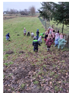
Osterspaziergang durch Bobbau