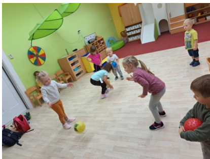
Sporttag in der Kita