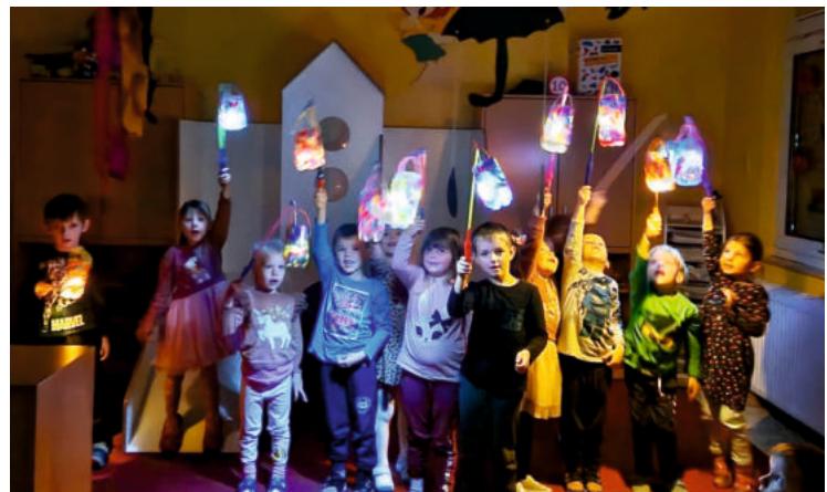
St. Martin in der Kita Pumuckl