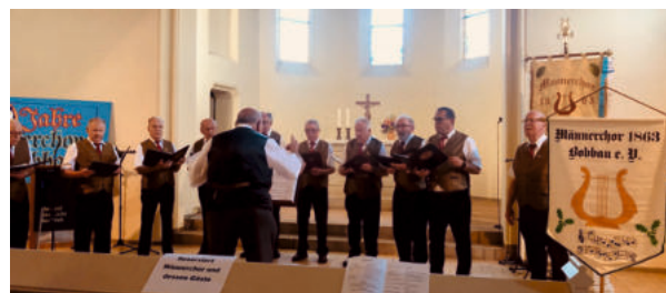
Männerchor beim Auftritt am Tag der Bobbauer