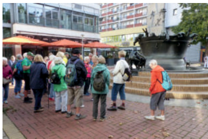
Durfte bei der Stadtführung nicht fehlen, der Faunbrunnen von dem Magdeburger Künstler Heinrich Apel.