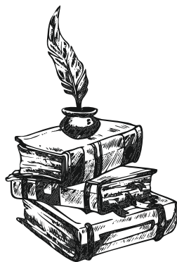
Geschichte(n) bewahren e.V.