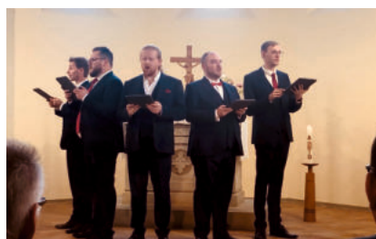
Ensemble Nobiles beim Auftritt am Tag der Bobbauer