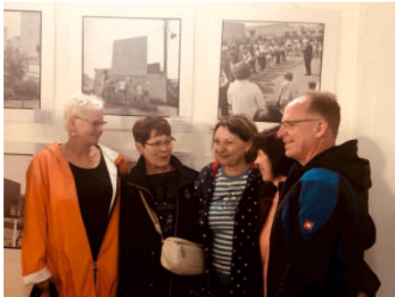
Wiedersehen im Wasserturm