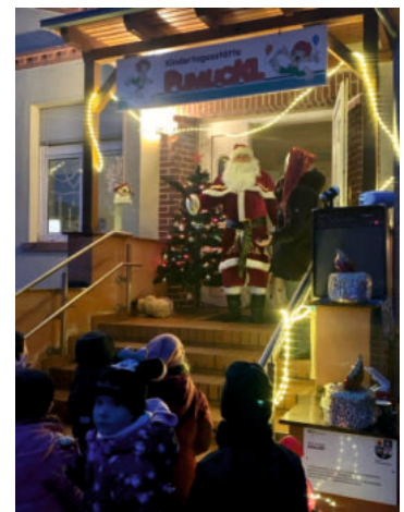
Der Weihnachtsmann besucht die Kita Pumuckl