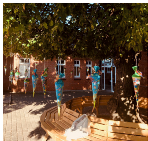
Unser Zuckertütenbaum trägt wieder Früchte