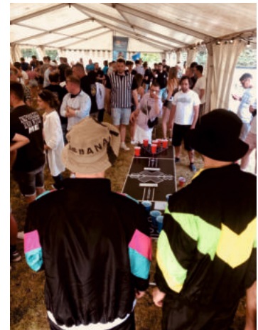
Die ersten Bobbauer Masters im Beerpong waren ein voller Erfolg