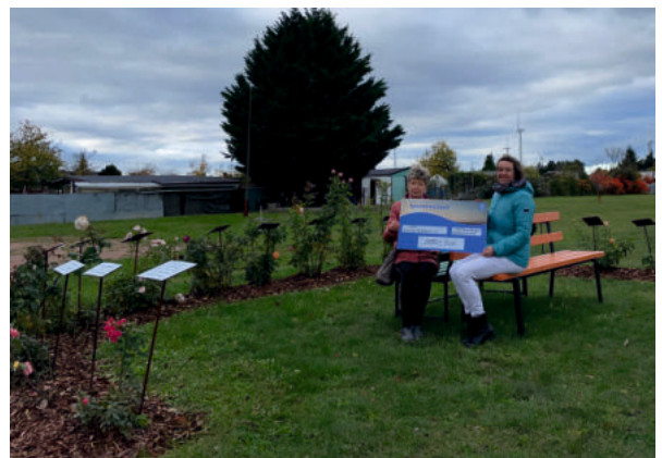
Scheckübergabe der Firma VSB Neue Energien Deutschland GmbH