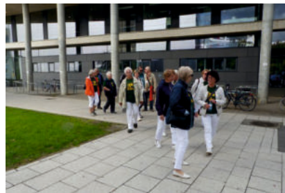
Das Ziel aller Wanderer, wie hier die Wanderfreunde aus Bobbau, die Mensa der Universität „Otto von Guericke“