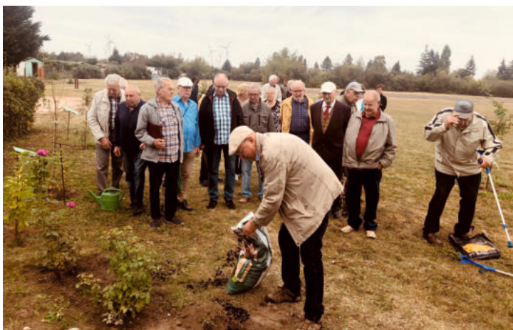
Pflanzung der Rose zum 160. Geburtstag unseres Männerchors im Rahmen des Bürgerbrunch zum Tag der deutschen Einheit