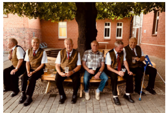
Männerchor nach dem Auftritt am Tag der Bobbauer