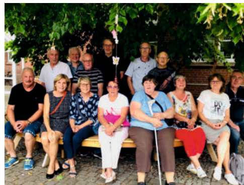
Klassentreffen 50 Jahre Ausschulung „POS Bobbau“