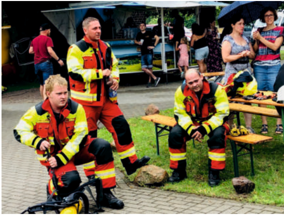
Der Firefighter Stairrun erlebte eine Neuauflage