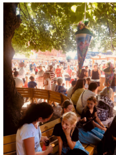
Impressionen vom Tag der Bobbauer