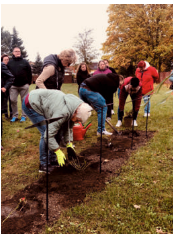
Rosenpflanzungen im Bürgergarten am Reformationstag