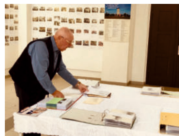
Der Heimatverein bereicherte den diesjährigen Bürgerbrunch