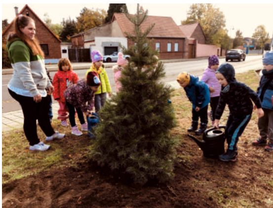
Pflanzung des Weihnachtsbaum in Bobbau