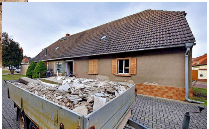
Gestaltung zur Begegnungsstätte soll Aufgabe der Dorfgemeinschaft werden