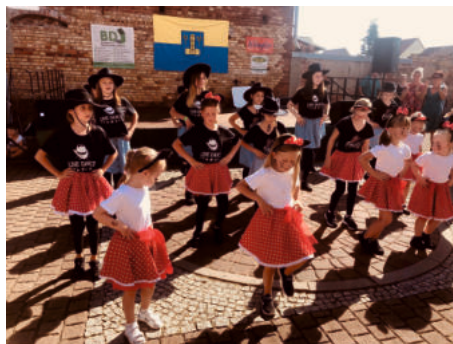
Tanzmäuse zum Tag der Bobbauer