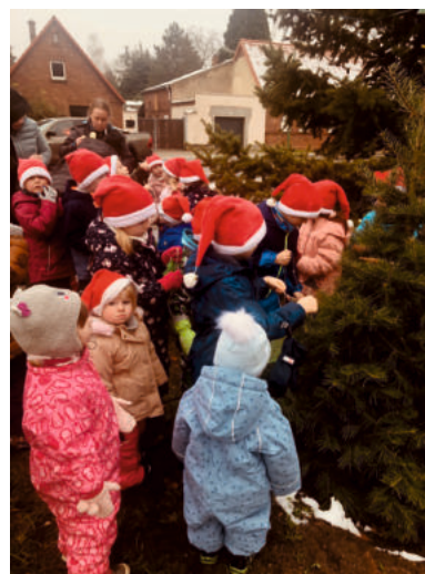
Am Nikolaustag schmückten unsere Kita-Kinder den Bobbauer Weihnachtsbaum