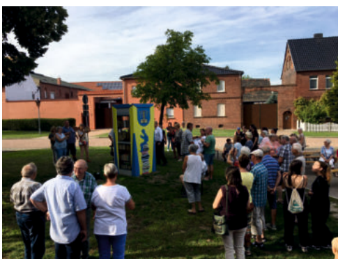
Wir haben eine gut genutzte Bobliothek