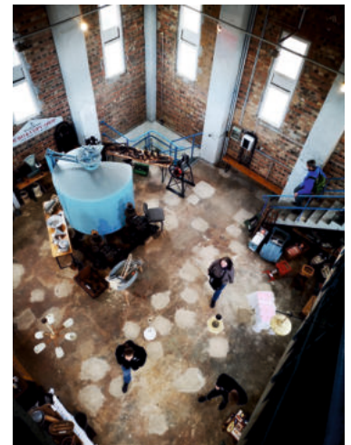
Die deutsche Wasserturmgesellschaft und IG Bitterfelder Geschichte erlebten eine Turmführung