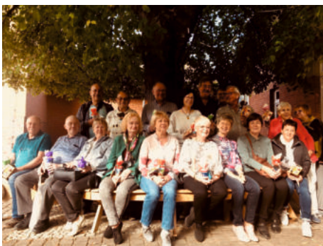
Klassentreffen 50 Jahren Ausschulung „EOS Wolfen“