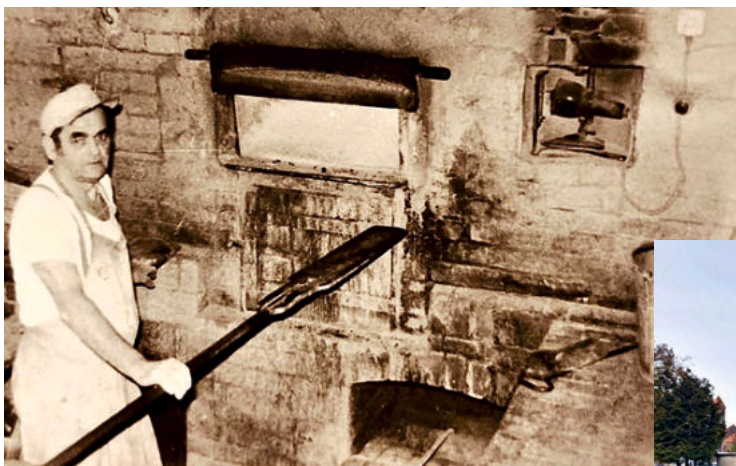
Bäcker Mönch in der damaligen Dorfgemeinschaftsbäckerei

Fragen und Wünsche zur Beteiligung können bereits jetzt an Buergergenossenschaft-Bobbau@web.de gerichtet werden.