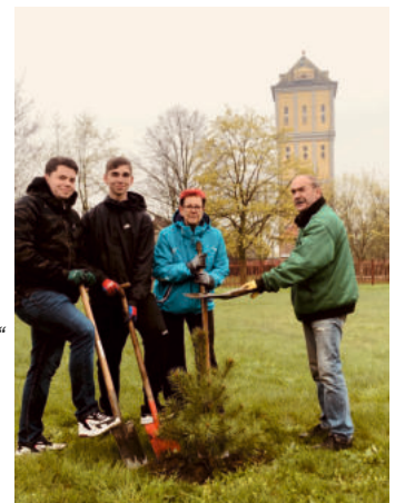
Ein verregneter Frühjahrsputz