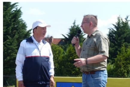
Adi zum ersten Bobbauer Familiensonntag

Danke an die Sportgaststätte Bobbau sowie den Wanderern vom SV Anhalt Bobbau für die kulinarische Ausgestaltung.