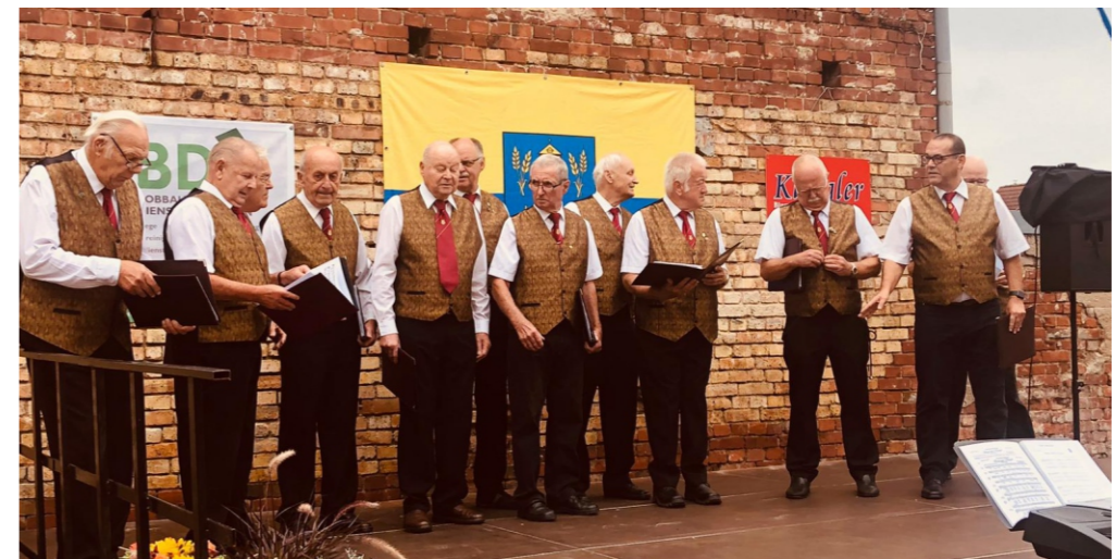
Männerchor 1863 Bobbau e.V.