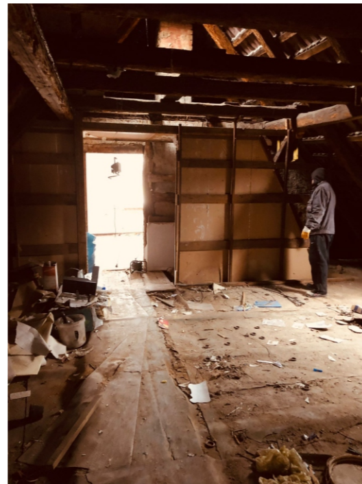
Entkernung hat begonnen