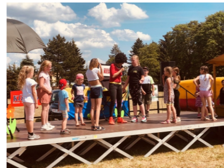
Kess und das tolle Mitmachprogramm